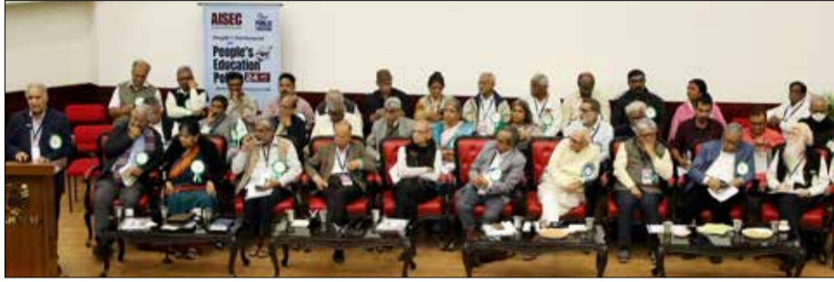
ವೇದಿಕೆಯಲ್ಲ: ದೇಶದ ವಿವಿಧ ಭಾಗಗಳಿಂದ ಆಗಮಿಸಿದ್ದ ವಿವಿಧ ಶೈಕ್ಷಣಿಕ ವಿಭಾಗಗಳ ತಜ್ಞರು