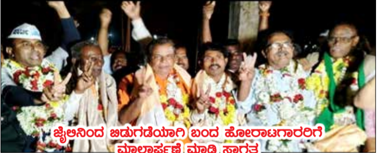
ಜೈಲಿನಿಂದ ಬಿಡುಗಡೆಯಾಗಿ ಬಂದ ಹೋರಾಟಗಾರರಿಗೆ ಮಾಲಾರ್ಪಣೆ ಮಾಡಿ ಸ್ವಾಗತ