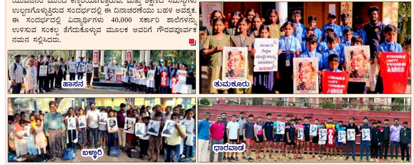
ಹಾಸನ, ತುಮಕೂರು, ಬಳ್ಳಾರಿ, ಧಾರವಾಡ

ಭಾರತದ ಸ್ವಾತಂತ್ರ್ಯ ಸಂಗ್ರಾಮದ ಕ್ರಾಂತಿಕಾರಿ ಸೇನಾನಿ ನೇತಾಜಿ ಸುಭಾಷ್‌ಚಂದ್ರ ಬೋಸ್ ಜನ್ಮ ದಿನಾಚರಣೆಯ ಸಂದರ್ಭದಲ್ಲಿ ಅವರ ವಿಚಾರಧಾರೆ, ಜೀವನ ಹೋರಾಟಗಳನ್ನು ಬೆಳೆಯುವ ಮಕ್ಕಳ ನಡುವೆ ತೆಗೆದುಕೊಂಡು ಹೋಗಲು ಆಲ್ ಇಂಡಿಯಾ ಡೆಮಾಕ್ರಟಿಕ್ ಸ್ಟೂಡೆಂಟ್ಸ್ ಆರ್ಗನೈಸೇಷನ್ (ಎಐಡಿಎಸ್‌ಓ) ಜನವರಿ 23 ರಂದು ಶಾಲಾ-ಕಾಲೇಜುಗಳಲ್ಲಿ, ಪಾರ್ಕ್‌ಗಳಲ್ಲಿ ಸಭೆಗಳನ್ನು ನಡೆಸಿತು. ಮಹೋನ್ನತ ವ್ಯಕ್ತಿಗಳ ಆದರ್ಶವು ವಿದ್ಯಾರ್ಥಿ-ಯುವಜನರ ಮುಂದೆ ಕಣ್ಮರೆಯಾಗುತ್ತಿರುವ, ಮತ್ತು ಶಿಕ್ಷಣದ ಸಮಸ್ಯೆಗಳು ಉಲ್ಲಾಗೊಳ್ಳುತ್ತಿರುವ ಸಂದರ್ಭದಲ್ಲಿ ಈ ದಿನಾಚರಣೆಯು ಬಹಳ ಅವಶ್ಯಕ. ಈ ಸಂದರ್ಭದಲ್ಲಿ ವಿದ್ಯಾರ್ಥಿಗಳು 40,000 ಸರ್ಕಾರಿ ಶಾಲೆಗಳನ್ನು ಉಳಿಸುವ ಸಂಕಲ್ಪ ತೆಗೆದುಕೊಳ್ಳುವ ಮೂಲಕ ಅವರಿಗೆ ಗೌರವಪೂರ್ವಕ ನಮನ ಸಲ್ಲಿಸಿದರು.