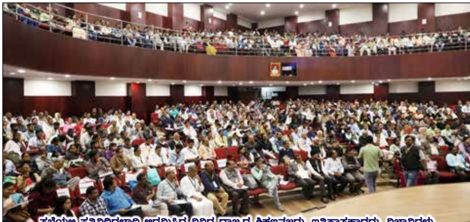
ಸಭೆಯಲ್ಲಿ: ಜ್ಞಾನಿಧಿಗಣಿ/ಆಗಮಿಸಿದ್ದ ವಿವಿಧ ರಾಜ್ಯದ ಶಿಕ್ಷಣತಜ್ಞರು, ಇತಿಹಾಸಕಾರರು, ವಿಜ್ಞಾನಿಗಳು, ಸಂಶೋಧನಾಕಾರರು, ವಿದ್ಯಾರ್ಥಿಗಳು, ಶಿಕ್ಷಣಪ್ರೇಮಿಗಳು