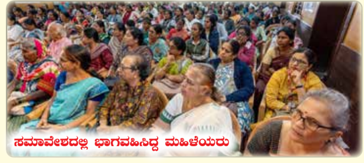
ಸಮಾವೇಶದಲ್ಲಿ ಭಾಗವಹಿಸಿದ್ದ ಮಹಿಳೆಯರು