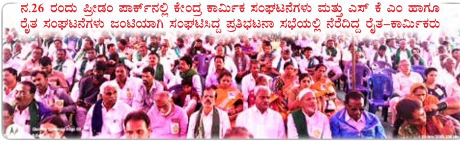
ನ.26 ರಂದು ಪ್ರೀಡಂ ಪಾರ್ಕ್‌ನಲ್ಲಿ ಕೇಂದ್ರ ಕಾರ್ಮಿಕ ಸಂಘಟನೆಗಳು ಮತ್ತು ಎಸ್ ಕೆ ಎಂ ಹಾಗೂ ರೈತ ಸಂಘಟನೆಗಳು ಜಂಟಿಯಾಗಿ ಸಂಘಟಿಸಿದ್ದ ಪ್ರತಿಭಟನಾ ಸಭೆಯಲ್ಲಿ ನೆರೆದಿದ್ದ ರೈತ-ಕಾರ್ಮಿಕರು

ನಿಶ್ಚಿತ ಅವಧಿಯ ಉದ್ಯೋಗ (fixed term employment) ಸಂಪೂರ್ಣವಾಗಿ ಕಾರ್ಮಿಕ ಕಾನೂನು ರಕ್ಷಣೆಯಿಂದ ಹೊರತಾಗಿರುವುದರಿಂದ, ಅಲ್ಲಿ ಯಾವುದೇ ರಕ್ಷಣೆ ಇಲ್ಲ. ಅನಿಯಮಿತ ತರಬೇತಿ ಮತ್ತು ತರಬೇತಿ ಹೊಂದಿದವರಿಗೆ ಅಲ್ಲಿಯೇ ಉದ್ಯೋಗ ನೀಡುವ ಯಾವುದೇ ಬದ್ಧತೆ ಇಲ್ಲದಿರುವುದು ಶೋಷಣೆಯ ಇನ್ನೊಂದು ಮಾರ್ಗವಾಗಿದೆ. ಉದ್ಯೋಗದಾತರ ಉಲ್ಲಂಘನೆಗಳನ್ನು ಅಪರಾಧ