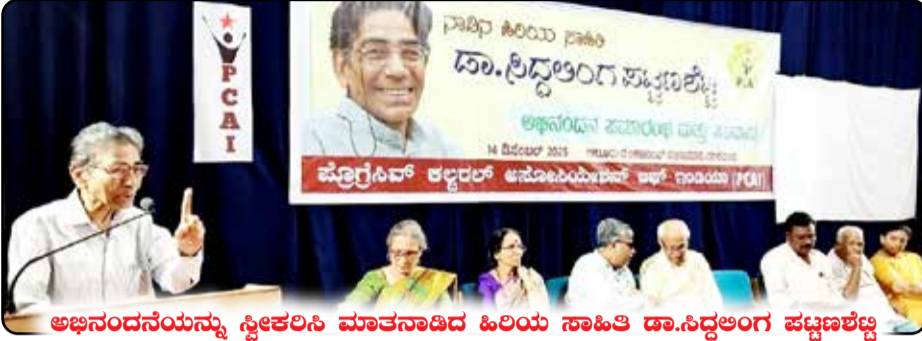
ಅಭಿನಂದನೆಯನ್ನು ಸ್ವೀಕರಿಸಿ ಮಾತನಾಡಿದ ಹಿರಿಯ ಸಾಹಿತಿ ಡಾ.ಸಿದ್ದಲಿಂಗ ಪಟ್ಟಣಶೆಟ್ಟಿ

ದಿನಿಯಲ್ಲದವರ, ಈ ಸಮಾಜದ ಅಂಚಿನಲ್ಲಿರುವ ಜನಸಾಮಾನ್ಯರ ಕುರಿತು ಬರೆದ ಸಾಹಿತ್ಯ ಬಹುಕಾಲ ನಿಲ್ಲುತ್ತದೆ. ಡಾ ಸಿದ್ದಲಿಂಗ ಪಟ್ಟಣಶೆಟ್ಟಿ ಅವರು ಭಾರತೀಯ ಭಾಷೆಗಳ ನಡುವಿನ ಸೇತುವೆಯಾಗಿ ಬಹುತ್ವವನ್ನು ಎತ್ತಿ ಹಿಡಿದ ಲೇಖಕಿ” ಎಂದು ಗೋವಾ ರಾಜ್ಯದ ಜ್ಞಾನಪೀಠ ಪ್ರಶಸ್ತಿ ಪುರಸ್ಕೃತ ಸಾಹಿತಿ ದಾಮೋದರ ಮೌಜೋ ಬಣ್ಣಿಸಿದರು. ಅವರು ಪುಸ್ತಕ ಕಲ್ಚರಲ್ ಅಸೋಸಿಯೇಶನ್ ಆಫ್ ಇಂಡಿಯಾ (ಪಿಸಿಎಐ) ಸಂಘಟನೆಯು ಧಾರವಾಡದ ಆಲೂರು ವೆಂಕಟರಾವ್ ಸಭಾಭವನದಲ್ಲಿ ಕೇಂದ್ರ ಸಾಹಿತ್ಯ ಅಕಾಡೆಮಿಯ ಪುರಸ್ಕಾರಕ್ಕೆ ಭಾಜನರಾಗಿರುವ ಸಿದ್ದಲಿಂಗ ಪಟ್ಟಣಶೆಟ್ಟಿ ಅವರ ಅಭಿನಂದನಾ ಸಮಾರಂಭ ಹಾಗೂ ಸಂವಾದ ಕಾರ್ಯಕ್ರಮವನ್ನು ಉದ್ಘಾಟಿಸಿ ಮಾತನಾಡಿದರು. ನಾವು ಈ ಸಮಾಜದ ಓರೆಕೋರೆಗಳ ಕುರಿತು ನಮ್ಮ ಭಿನ್ನಮತವನ್ನು ದಾಖಲಿಸಲು ಬರೆಯಬೇಕು. ಅಂದಾಗ ಮಾತ್ರ ಒಂದು ಹೊಸ ಎಚ್ಚರ ಮೂಡಲು ಸಾಧ್ಯ. ದೇಶದಲ್ಲಿ ಎಲ್ಲ ಭಾಷೆಗಳು ಶ್ರೇಷ್ಠವೇ. ಯಾವ ಭಾಷೆಯನ್ನೂ ಸಹ ನಾವು ತಿರಸ್ಕರಿಸಬಾರದು. ಆದರೆ, ಯಾವುದೇ ಭಾಷೆಯ ಹೇರಿಕೆಯಿಂದ ಸಮಸ್ಯೆಗಳು ಉದ್ಭವಿಸುತ್ತವೆ. ಯುವ ಲೇಖಕರು ತಮ್ಮ ಪರಂಪರೆಯ ಮೌಲ್ಯಗಳನ್ನು ಹೀರಿಕೊಂಡು ಹೊಸದನ್ನು ಕಟ್ಟಲು ಪ್ರಯತ್ನಿಸಬೇಕು ಎಂದು ಅವರು ಅಭಿಪ್ರಾಯಪಟ್ಟರು.