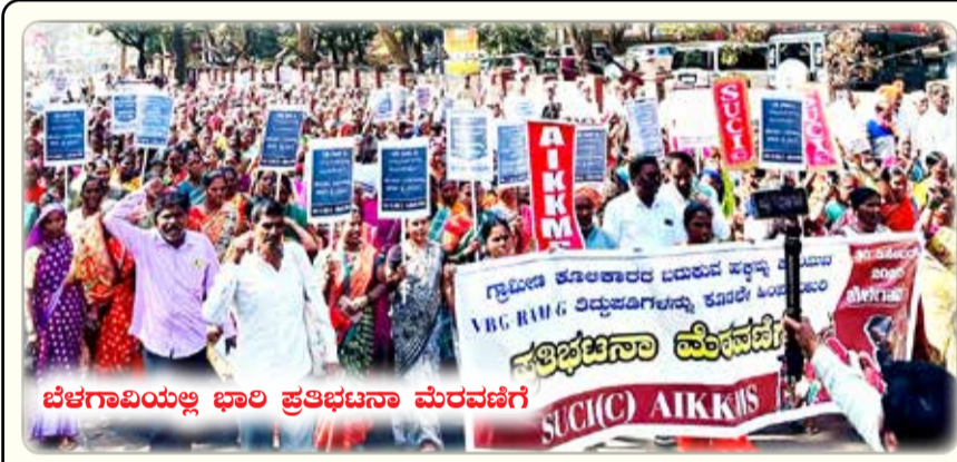
ಬೆಳಗಾವಿಯಲ್ಲಿ ಭಾಲಿ ಪ್ರತಿಭಟನಾ ಮೆರವಣಿಗೆ