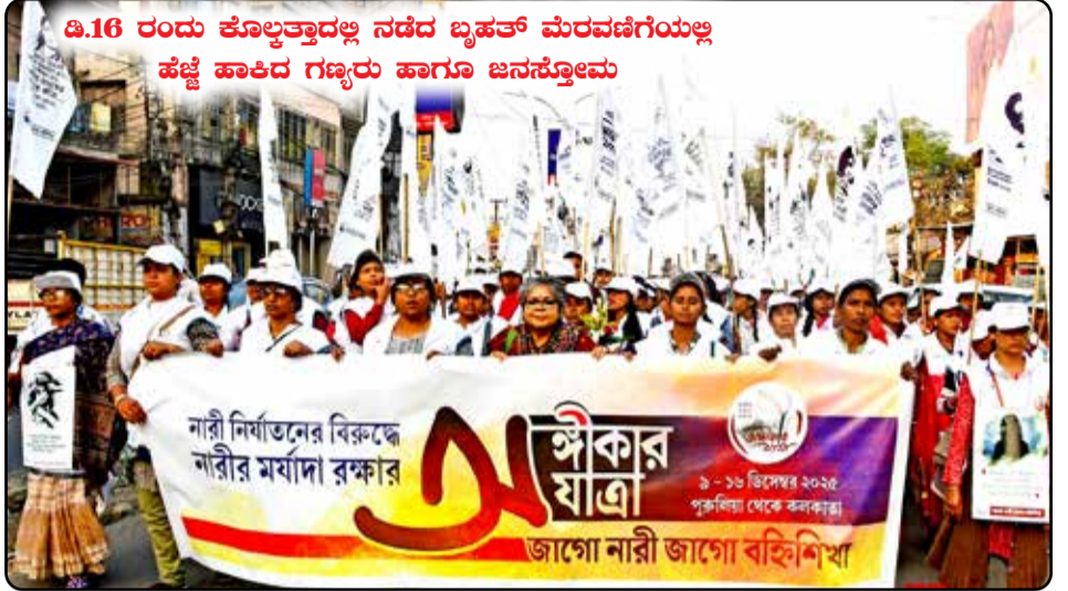
ಡಿ.16 ರಂದು ಕೊಲ್ಕತ್ತಾದಲ್ಲಿ ನಡೆದ ಬೃಹತ್ ಮೆರವಣಿಗೆಯಲ್ಲಿ ಹೆಚ್ಚು ಹಾಸಿದ ಗಣ್ಯರು ಹಾಗೂ ಜನಸಂಖ್ಯೆ

ಸುಚಿಂತಕರು ನ್ಯಾಯಕ್ಕಾಗಿ ತಮ್ಮ ಪ್ರತಿಭಟನೆಯ ಧ್ವನಿಯನ್ನು ಎತ್ತುತ್ತಿರುವಾಗ, ಸರ್ಕಾರದ ಪ್ರತಿಕ್ರಿಯೆಯು ಸಂಪೂರ್ಣವಾಗಿ ತಿರಸ್ಕಾರದಿಂದ ಕೂಡಿದೆ. ಆಡಳಿತ ವ್ಯವಸ್ಥೆಯು ಅಪರಾಧಿಗಳನ್ನು ರಕ್ಷಿಸಲು ಮಾತ್ರ ಕಾರ್ಯನಿರತವಾಗಿದೆ. ವಾಸ್ತವದಲ್ಲಿ, ಇಂತಹ ವಿಕೃತ ಪ್ರವೃತ್ತಿಗಳು ಸಮಾಜವನ್ನು ವಿಶೇಷವಾಗಿ ಯುವಕರನ್ನು ಆವರಿಸಬೇಕೆಂದು ಆಲೈಕರು ಬಯಸುತ್ತಾರೆ. ಏಕೆಂದರೆ ಯುವಕರಲ್ಲಿ ಮಾನವೀಯತೆಯನ್ನು ಕಸಿದುಕೊಂಡು, ಅವರನ್ನು ಮೂಕರನ್ನಾಗಿ ಮಾಡಲು ಮತ್ತು ತಮ್ಮ ಆಜ್ಞೆಗಳಿಗೆ ಅಧೀನಗೊಳಿಸಲು ಹಾಗೂ ಸಮಾಜವನ್ನು ಮರಗಟ್ಟಿಸಲು ಅವರು ಬಯಸುತ್ತಾರೆ. ಆದರೆ ಅವರ ಎಲ್ಲಾ ಪ್ರಯತ್ನಗಳ ಹೊರತಾಗಿಯೂ ಸಹ,