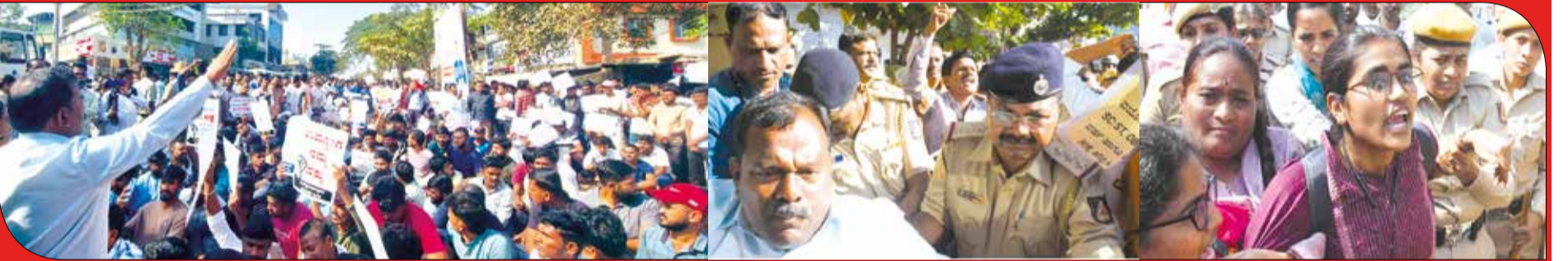
ಹೋರಾಟದ ಹಕ್ಕನ್ನು ನಿರಾಕರಿಸಿದ ಪೊಲೀಸರು: ಧಾರವಾಡದಲ್ಲಿ ಉದ್ಯೋಗಾಕಾಂಕ್ಷಿಗಳ ಹೋರಾಟ ಸಮಿತಿ ಹಾಗೂ ಜನಸಾಮಾನ್ಯರ ವೇದಿಕೆ ನೇತೃತ್ವದಲ್ಲಿ ಶಾಂತಿಯುತವಾಗಿ ಪ್ರತಿಭಟನಾ ಮೆರವಣಿಗೆ ನಡೆಸಲು ಮುಂದಾದ ಯುವಜನರನ್ನು ಪೊಲೀಸರು ಚದುರಿಸಿ, ಅವರ ನಾಯಕರನ್ನು ಬಂಧಿಸಿದರು.