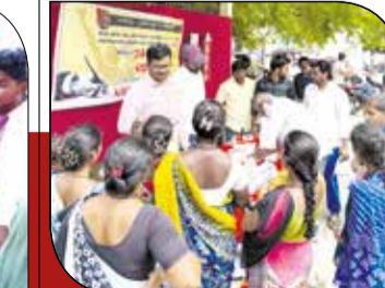
ಸಹಿ ಮಾಡುತ್ತಿರುವ ಸಾರ್ವಜನಿಕರು