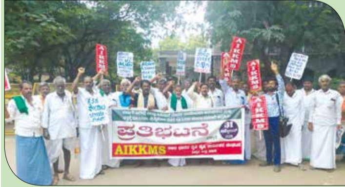
ಮಕ್ಕಜೋಳ ಬೆಳೆಗೆ ಕ್ಷಿಂಟಾಅಗೆ ರೂ. 3000 ಬೆಂಬಲ ಬೆಲೆ ನೀಡಿ, ಸರ್ಕಾರವೇ ಐಲಿಐಸಿಎಂಎಂ ಒತ್ತಾಯಿಸಿ ಎಐಕೆಎಮ್‌ಎಸ್ ಬಳ್ಳಾರಿ ಜಿಲ್ಲಾ ಸಮಿತಿಯ ನೇತೃತ್ವದಲ್ಲಿ ನಡೆದ ಪ್ರತಿಭಟನೆ.