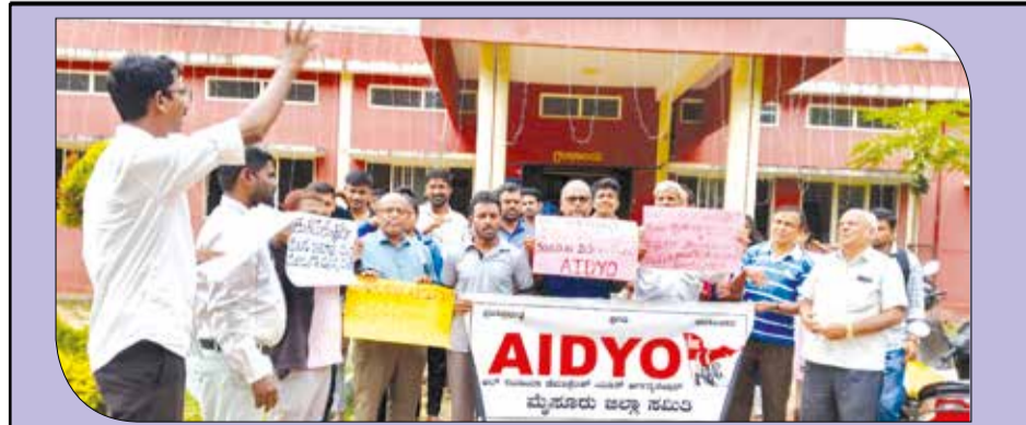
ಮೈಸೂರಿನ ಕುವೆಂಪು ನಗರ ಸಾರ್ವಜನಿಕ ಗ್ರಂಥಾಲಯದಲ್ಲಿ ಕುಡಿಯುವ ನೀರು, ಸ್ವಚ್ಛತೆ ಹಾಗೂ ಇನ್ನಿತರ ಮೂಲಭೂತ ಸೌಲಭ್ಯಗಳಿಗೆ ಆಗ್ರಹಿಸಿ ಎಣಿವೆಟ್ಟು ಮತ್ತು ಸಾರ್ವಜನಿಕ ಗ್ರಂಥಾಲಯದ ಓದುಗರ ಬಳಗದ ನೇತೃತ್ವದಲ್ಲಿ ಪ್ರತಿಭಟನೆ ಮಾಡಲಾಯಿತು. ಪ್ರತಿಭಟನೆಯ ನಂತರ ಸ್ವಚ್ಛತೆ ಮತ್ತು ಕುಡಿಯುವ ನೀರಿನ ಸಮಸ್ಯೆ ಬಗೆಹರಿಸಲಾಗಿದೆ.

ಆದ್ದರಿಂದ, ಕಾರ್ಮಿಕ ವರ್ಗವು ಬಂಡವಾಳಶಾಹಿ ದಬ್ಬಾಳಿಕೆಯಿಂದ ಮುಕ್ತವಾಗಬೇಕೆಂದರೆ, ಕೆಲಸದ ಅವಧಿ ಹೆಚ್ಚಿಸುವ ಬಂಡವಾಳವಾದದ ಶೋಷಣೆಯ ವಿರುದ್ಧ, ಸರಿಯಾದ ಕ್ರಾಂತಿಕಾರಿ ನಾಯಕತ್ವದ ಅಡಿಯಲ್ಲಿ ಬಂಡವಾಳಶಾಹಿ-ವಿರೋಧಿ ಸಮಾಜವಾದಿ ಕ್ರಾಂತಿಗೆ ಮುನ್ನುಗ್ಗುವಂತಹ ವರ್ಗ ಮತ್ತು ಸಾಮೂಹಿಕ ಹೋರಾಟಗಳನ್ನು ತೀವ್ರಗೊಳಿಸಬೇಕು. ಈ ಮೂಲಕ ದಬ್ಬಾಳಿಕೆಯ ಬಂಡವಾಳಶಾಹಿ ವ್ಯವಸ್ಥೆಯನ್ನು ಉರುಳಿಸಿ, ಕಾರ್ಮಿಕರ ನಿರ್ದಯ ಶೋಷಣೆಯ ನೊಗದಿಂದ ಕಾರ್ಮಿಕರು ತಮ್ಮನ್ನು ವಿಮುಕ್ತಿಗೊಳಿಸಿಕೊಳ್ಳಬೇಕು. ■