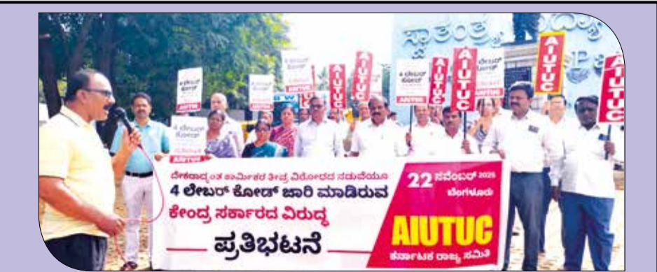
ಎಣಿಯುಟ್ಟಿಯು: ಚಾಲ್ತಿಯಲ್ಲಿರುವ ಕಾರ್ಮಿಕ ಕಾಯಿದೆಗಳನ್ನು ರದ್ದುಗೊಳಿಸಿ, ಬಂಡವಾಳಶಾಹಿ ಪರವಾದ 4 ಕಾರ್ಮಿಕ ಸಂಹಿತೆಗಳನ್ನು ಜಾರಿಗೆ ತಂದ ಕೇಂದ್ರ ಬಿಜೆಪಿ ಸರ್ಕಾರದ ವಿರುದ್ಧ ನವೆಂಬರ್ 22ರಂದು ಸ್ವಾತಂತ್ರ್ಯ ಉದ್ಯಾನವನದಲ್ಲಿ ನಡೆದ ಪ್ರತಿಭಟನೆ.