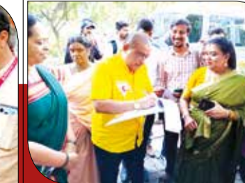
ಸಂಗೀತ ಸಂಯೋಜಕರಾದ ಡಾ. ಹಂಸಲೇಖ